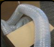
Węże i złączki