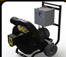
Gazowy i elektryczny odkurzacz